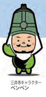
三井寺キャラクター ペンペン

後援/関東大道芸研究会・滋賀県バルーンアート協会・滋賀県江州音頭保存会・滋賀県南京玉すだれ保存会・ちんどん屋こうあん一座・さざなみ太鼓・ていだkankan・ききょうちゃん一座・伊吹山ガマの油口上保存会・待(まつ)コミュニケーション・紙芝居夢屋商店・よさこい元気隊・夢華会・花架拳・ふじの木茶屋