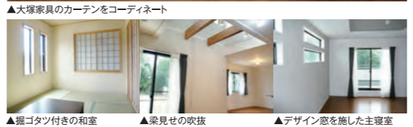
▲大塚家具のカーテンをコーディネート ▲据コタツ付きの和室 ▲梁見せの吹抜 ▲デザイン窓を施した主寝室