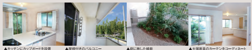
▲キッチンにカップボードを設置 ▲屋根付きのバルコニー ▲庭に施した植栽 ▲大塚家具のカーテンをコーディネート

独立性を高めた2階の居室は、全部屋2面開口を実現。採光と風通しを考えました。各部屋にはクローゼットをご用意。2階トイレも便利です。