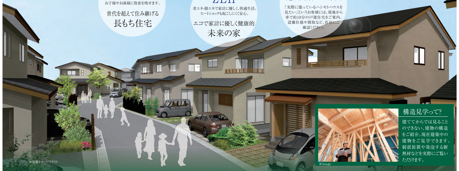
※街並イメージイラスト