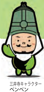
三井寺キャラクター ベンベン

後援(会場) / 天台寺門宗 総本山 三井寺(園城寺) 滋賀県大津市園城寺町246 TEL(077)522-2238 後援 / 関東大道芸研究会・滋賀県バルーンアート協会・滋賀県江州音頭協会・ 滋賀県南京玉すだれ保存会・ちんどん屋こうあん一座・さざなみ太鼓 ていだkankan・ききょうちゃん一座・伊吹山ガマの油口上保存会・ 待(まつ)コミュニケーション・紙芝居夢屋商店