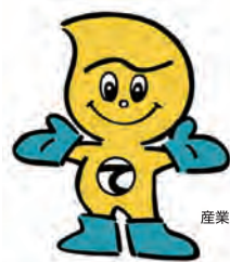
産業廃棄物適正処理のマスコット 「てき丸君」