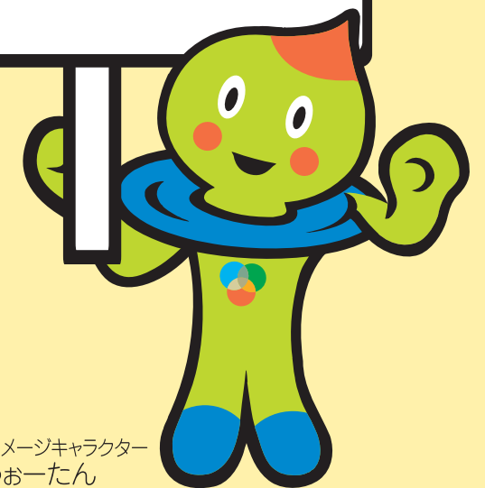
滋賀県イメージキャラクター うおーたん

3R(リデュース・リユース・リサイクル) 「いつか」じゃなくて「今から」 「だれか」じゃなくて「私から」 それが地球をまもる第一歩!!